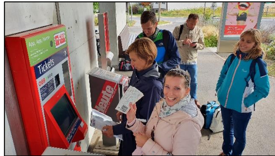
Sustainable Mobility Challenge v Bratislave - Hrad Devín, Slavín a Kamzík