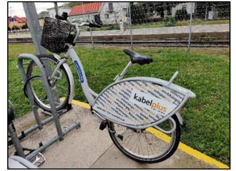
Stanica v Neusiedl am See - hodnotenie multimodality