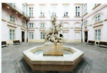
Súsošie sv. Juraja