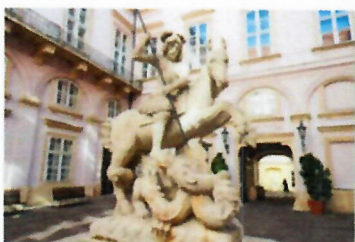
Socha sv. Juraja_detail