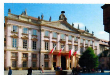
Primaciálny palác_čelný pohľad