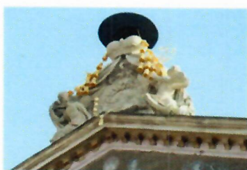
Kardinálsky klobúk_ arcibiskupska čiapka